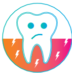
Enfermedad subyacente de la encía